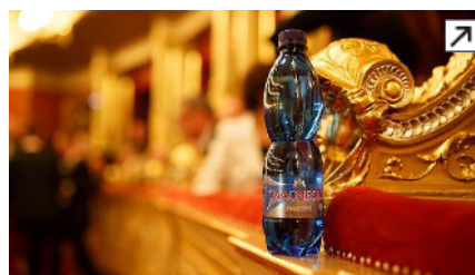
S Magnesií na cenách Thálie